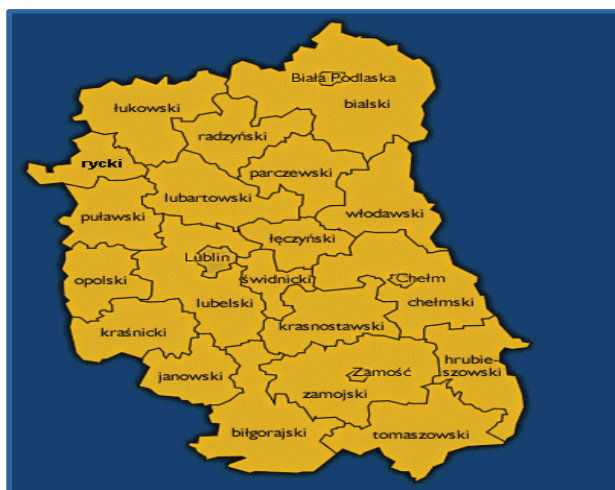
Rys. 1. Podział administracyjny województwa lubelskiego według powiatów