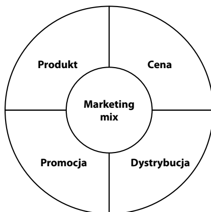
Rys. 2. Marketing mix — koncepcja 4P