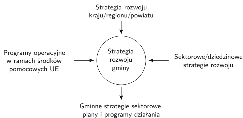
Rys. 1. Zależność dokumentacji strategicznej na poziomie gminy

Punktem wyjścia do prowadzonej analizy jest ustalenie znaczenia programowania i planowania rozwoju oraz ustalenia systemu powiązań poszczególnych dokumentów ze sobą. W tym przypadku należy mieć na uwadze nie tyle bezpośrednie powołanie na poszczególne dokumenty ale na merytoryczną spójność celów zawartych w tych dokumentach. Programowanie rozwoju to całościowe podejście do planowania (Stoner i inni 2001, s. 25) na różnym poziomie szczegółowości (Kudłacz 1999; Szlachta 1997, s. 5). Do głównych elementów programowania zaliczyć należy proces budowania m.in.: strategii, programów operacyjnych, planów działań i projektów rozwojowych (Brandenburg 2003, s. 38–39). Tym samym planowanie jest częścią systemu określania spójnych celów, czyli programowania rozwoju. Na poziomie gminy identyfikuje się zatem system zależności dokumentacji strategicznej (rys. 1), który ma charakter modelowy. Nie wskazano zależności jakie występują pomiędzy dokumentacją strategiczną reprezentowaną tu przez programy operacyjne UE oraz pozostałymi formami strategii rozwoju. 4